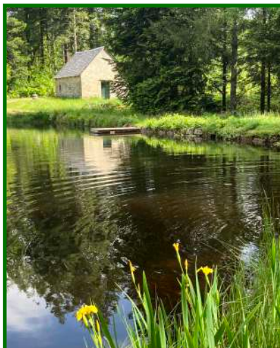
Iris sauvages à l'étang de Pissevache