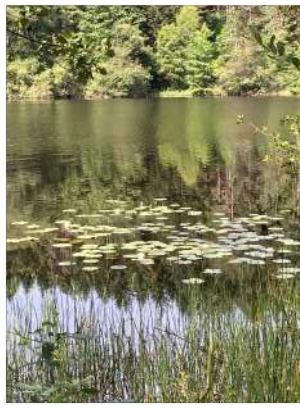
Nénuphars à l'étang de Pissevache, mois de juillet