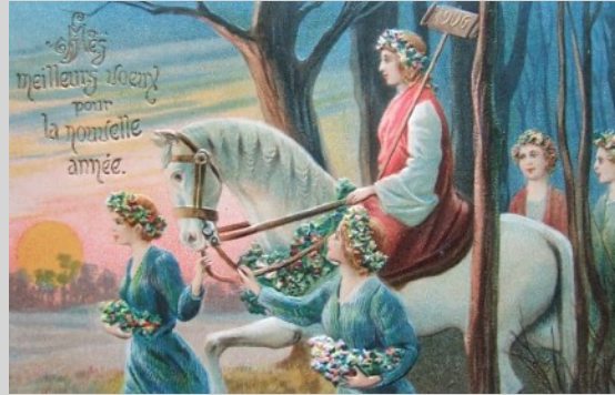
(Carte de Voeux pour l'année 1906)

Tous les mois nous vous présentons films de fiction, documentaires ou séries basés sur des faits parvenus en Corrèze ou filmés en Corrèze..... Ce mois-ci. "Adolescentes" (2019)