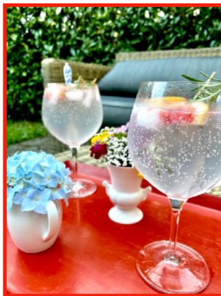
“ C'est l'été “